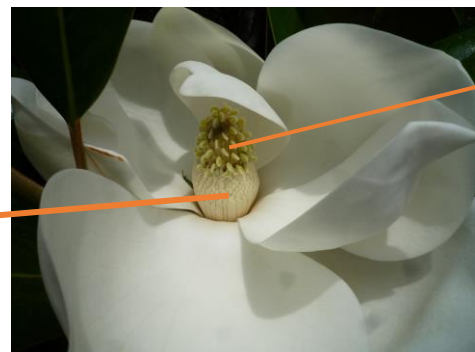
雌しべが熟して開き雄しべは閉じている