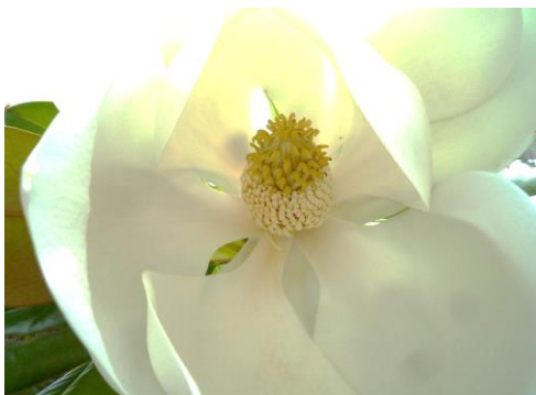
雄しべが熟して開いている