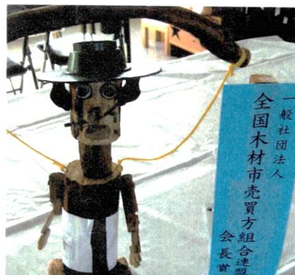
全買連会長賞の昨年の作品