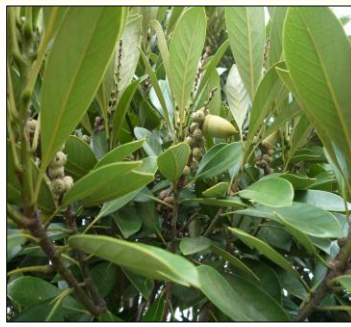
7月頃、昨年の実が大きくなる