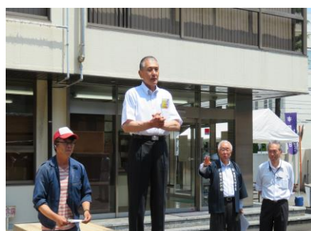
東京木材市場「都買連創立42周年記念市」