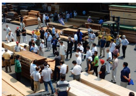
東京中央市場「浦安32周年記念市」

中央市場は、7月8日（土）「浦安開設32周年記念市」、東木市場は7月6日（木）「都買連創立42周年記念市」です。