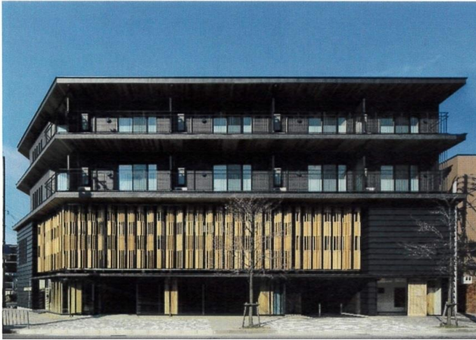
京都木材会館の外観(表彰式資料より)

施主 京都木材協同組合 設計者 (株) ゆう建築設計事務所 施工者 吉村建設工業