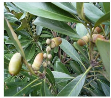
9月、昨年の実が成熟、今年の実と同居