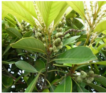
6月頃の今年の花と昨年結実した実